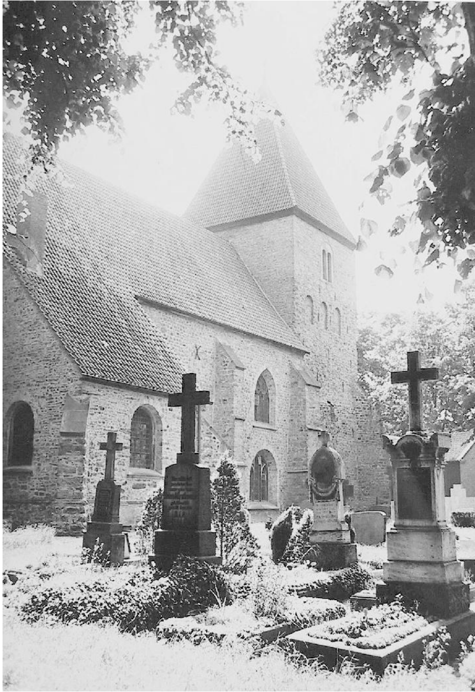
Friedhof an der Flaesheimer Stiftskirche Aufnahme um 1965